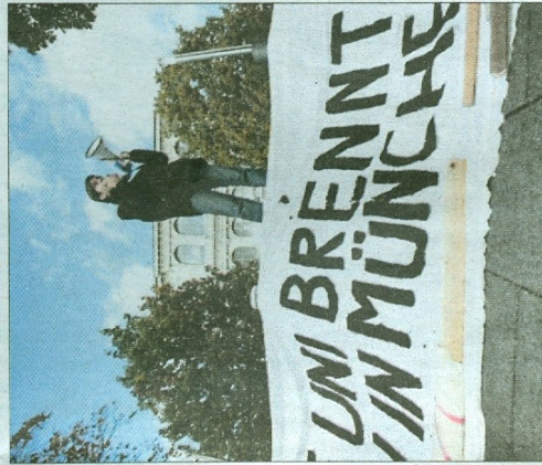
Gehör verschaffen für politischen Forderungen: Studentenproteste in der Akademiestraße.

Jetzt erfasse die Welle auch Deutschland, verkünden die Münchner Studenten, gleichzeitig mit der Aktion an der Akademie liefen Proteste in Hamburg, Heidelberg, Münster und Potsdam. Die Studenten wollen eine „bildungspolitische Kehrtwende“ erreichen – in einer Gesellschaft, in der Bildung nun einmal die „einzige Zukunftschance“ sei. Sie for-